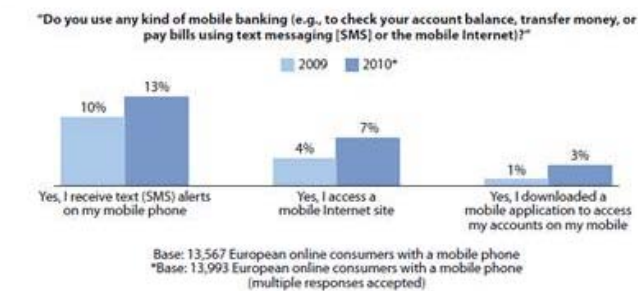
Figure 2 Mobile Banking is Taking Off Among Western Europeans